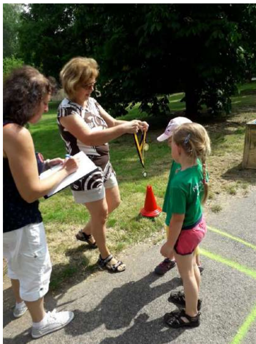
Předávání medailí v cíli závodu!