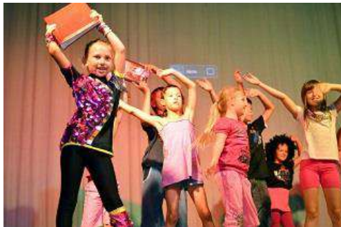
Ukázka z muzikálu

Určitě přijďte, poznáte tu spoustu nových lidí a naučíte se něco nového! Více informací zjistíte jednoduše tak, že si na Googlu zadáte Umělecká agentura Ambrozia.